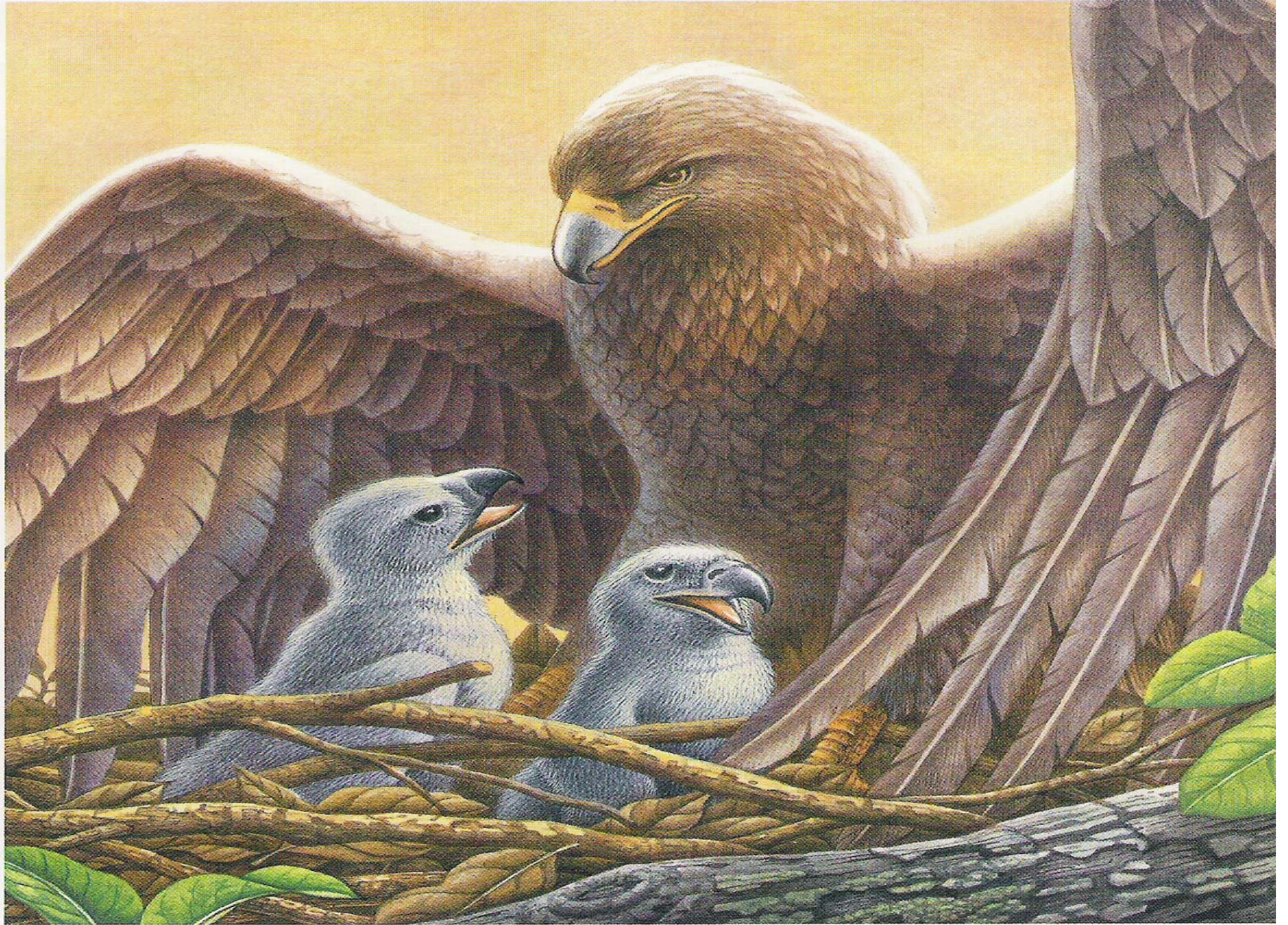
The eaglets taking their parent's covering.